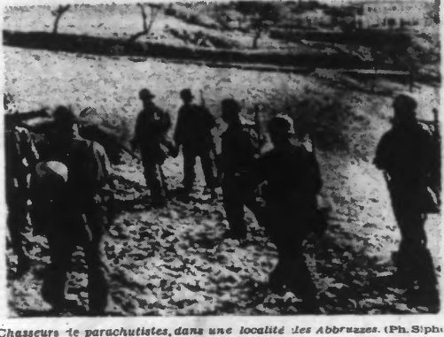
Chasseurs de parachutistes, dans une localité des Abruzzes.

À l'ouest de Rostov, de puissantes forces ennemies sont passées à l'attaque sur un large front à l'ouest de la ville. Ces attaques ont été repoussées avec de lourdes pertes pour les Soviétiques, mais l'intervention de puissantes forces blindées et d'avions d'assaut de la Luftwaffe a permis de perdre, dans ce secteur, 56 chars dont 57 dans le secteur d'un seul corps.