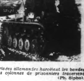
En BOSNIE, les unités motorisées allemandes harcèlent les bandes ennemies ; toujours de nouvelles colonnes de prisonniers traversent les villages.

80 TRANSPORTS ET PÉTROLIERS ARRIVENT À GIBRALTAR Madrid, 9. — On mande de La Lince qu'un convoi comprenant 80 gros transports et pétroliers venant de l'Atlantique et poussés par les vents plus tendues et qu'aucune amélioration n'est envisagée avant la fin de la guerre.