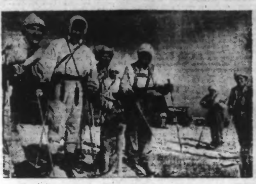
Soldats finlandais, en compagnie d'hiver..