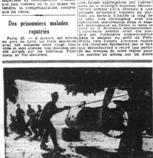
Chargement d'une lourde bombe sur un avion allemand.

Berlin, 25. — Les milieux militaires compétents des Affaires étrangères du Reich ont pris connaissance de la réaction que les événements de Hongrie ont provoquée dans le camp adverse où l'on espérait que la Hongrie constituerait en Europe un élément perturbateur, alors qu'en réalité, souligne-t-on à