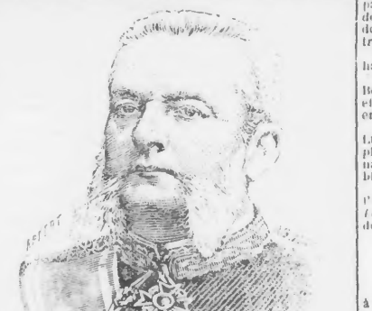
M. L'AMIRAL BESNARD Ministre de la Marine