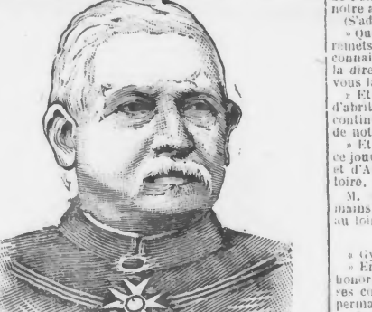
M. le GÉNÉRAL DE FRANCE