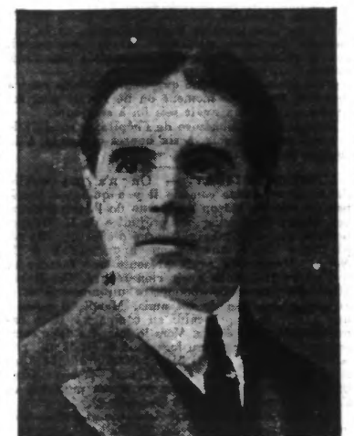
DARE DEVIL SCHREYER Le célèbre plongeur à bicyclette

LE PLONGEUR A BICYCLETTE De plus fort en plus fort. — Schreyer à l'Exposition de Tourcoing. — Une acrobatie cycliste qui lève loin derrière elle toutes les autres. — Un saut de 33 mètres. Le plongeur final.