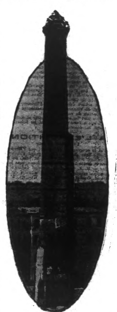
L'UN DES NUMEROS SENSATIONNELS DE SCHREYER Il pédale sur un « home-trainer » au haut d'une cheminée de 60 mètres

ploment parce qu'il est impressionnant, mais qui cherchent à le raisonner en quelque sorte, il est une autre considération intéressante: Le « numéro » de Schreyer est un véritable tour de force où l'adresse, le sang-froid et l'intelligence tiennent un