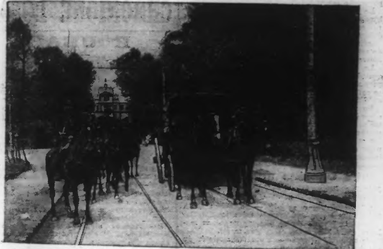
A MAISONS-LAFFITE: UN "VAN" GARDÉ PAR LES GENDARMES

Les dispositions ministérielles. — Un incident