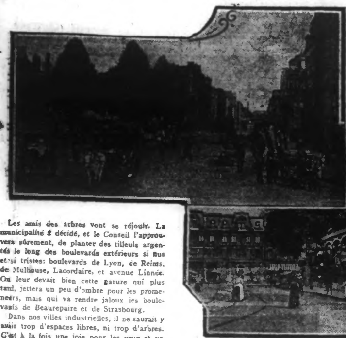
EN HAUT : Les arbres de la Place Chevreul (Rue de la Gare) EN BAS : Les arbres disparus de la Grand'Place, autour de l'Ancienne Bourse

On va faire de nouvelles plantations Nos arrière-neveux nous devons cet ombrage