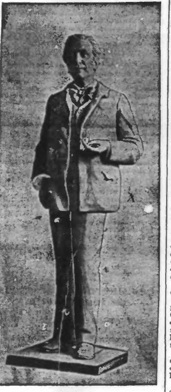
LA STATUE DE COPPÉE inaugurée dimanche à Paris

Le prochain conseil Paris, 5 juin. — Les ministres tiendront lundi, à l'Élysée, sous la présidence de M. Fallières, le dernier conseil de cabinet avant la lecture de la déclaration ministérielle à la Chambre.