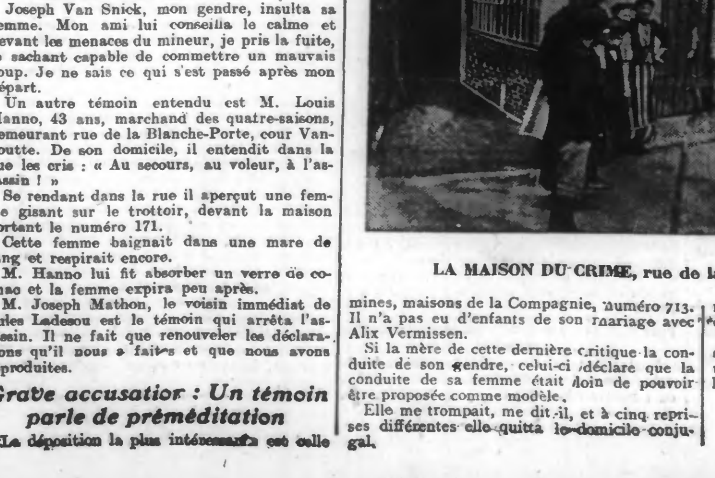
LA MAISON DU CRIME, rue de la Blanche-Porte, cour Delrou

Grave accusation : Un témoin parle de préméditation ... La déposition la plus intéressante est celle de M. Edouard Lézy, trieur, demeurant rue de la Blanche-Porte, cour Maret, 1.