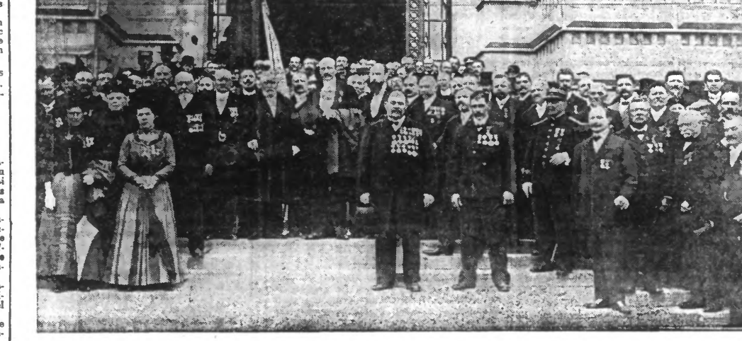
Les Sauveteurs du Nord et du Pas-de-Calais sur le perron de l'Hôtel de Ville

La réception par la Municipalité. - La messe - La distribution des récompenses. - Le banquet