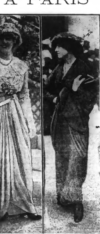
TOILETTES VUES A LONGCHAMP

Le traitement comporte quatre indications essentielles : repos absolu que possible ; régime lacto-végétarien ; administration de théobromine ; emploi de médicaments vasodilatateurs tels que trinitrine, nitrite d'amyle, etc.