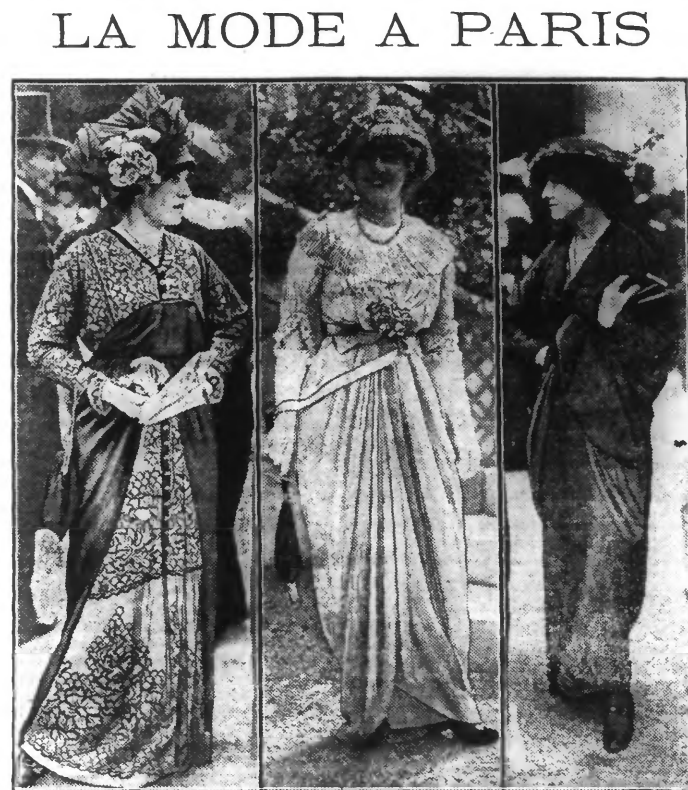
TOILETTES VUES A LONGCHAMP

Le traitement comporte quatre indications essentielles : repos absolu que possible ; régime lacto-végétarien ; administration de théobromine ; emploi de médicaments vasodilatateurs tels que trinitrine, nitrite d'amyle, etc.