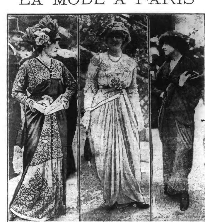
TOILETTES VUES A LONGCHAMP

Le traitement comporte quatre indications essentielles : repos absolu que possible ; régime lacto-végétarien ; administration de théobromine ; emploi de médicaments vasodilatateurs tels que trinitrine, nitrite d'amyle, etc.