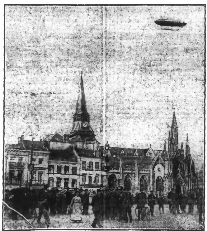
LE PASSAGE DU DIRIGEABLE "DUPUY-DE-LOME" AU-DESSUS DE ROUBAIX

Maubeuge, apparut tout à coup à l'horizon, dessinait nettement dans l'air vaporeux son imposante silhouette. La nouvelle de cette sensationnelle visite fut vite répandue par les premières personnes qui avaient aperçu la nef aérienne et, en quelques instants, grand nombre d'habitants s'ingénierent à suivre le plus longtemps possible le trajet du dirigeable.