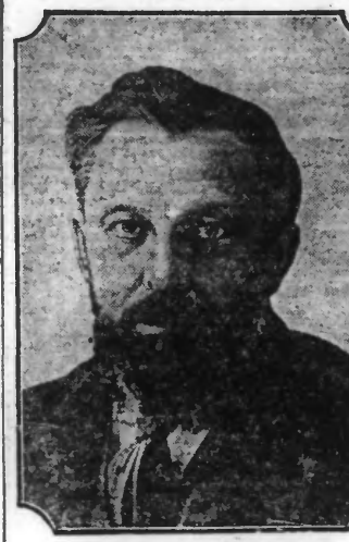
M. STEEG, ministre de l'Intérieur

Paris, 19 janvier. — Le Cabinet est définitivement constitué de la manière suivante: Présidence du Conseil et Affaires étrangères... MILLERAND. Intérieur... STEEG. Justice... LHOPEAU. Guerre... ANDRÉ LEFÈVRE. Marine... LANDRY. Commerce... ISAAC. Agriculture... HENRI RICARD. Finances... FRANÇOIS MARSAU. Travaux publics... ALBERT BARRAUD. Instruction publique... LE TROQUER. Travail... HONNORAT. Hygiène et Prévoyance sociale... JOURDAIN. Régions libérées... OGIER. Sous-Secrétaires d'Etat: M. Reibel, député de Seine-et-Oise, pour la présidence du Conseil. Intérieur, M. David. Agriculture, M. Queuille, député de Corrèze. Ravitaillement, M. Thommyre, député de Seine-Inférieure. Finances, M. Emmanuel Brousse. P.T.T., M. Louis Deschamps. Transports aéronautiques, M. Flamin. Service de l'Hydraulique, M. Borrel, député de la Savoie. Paris, transports et marine marchande, M. Paul Bignon. Enseignement technique au ministère de l'Instruction publique, M. Coupat, ex-secrétaire général de la Fédération des ouvriers mécaniciens.