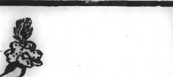
Le Dentol se trouve dans toutes les bonnes maisons vendant de la parfumerie et dans les pharmacies.

CADEAU Il suffit d'envoyer à la Maison FRÈRE, 19, rue Jacob, Paris, un franc en timbres-poste en se recommandant du Journal de Roubaix pour recevoir, franco par la poste, un délicieux coffret contenant un petit flacon de Dentol, une boîte de Pâte Dentol, une boîte de Poudre Dentol et un échantillon de Savon dentifrice Dentol.