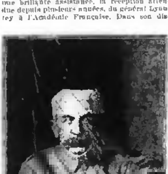
LE GENERAL LYAUTEY

Paris, 8 juillet. — Jeudi a eu lieu, devant une brillante assistance, la réception attendue depuis plusieurs années, du général Lyautey à l'Académie française.