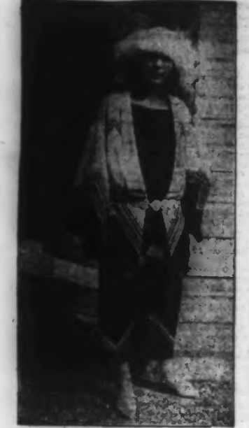
TOILETTE VUE AUX COURSES