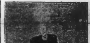
LE ROI ALEXANDRE

OBSEQUES DRAMATIQUES A ROME. DES ANARCHISTES FONT FEU SUR LES ASSISTANTS DU CORTÈGE.