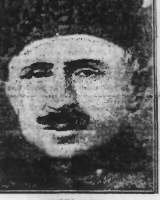
REFET-PACHA commandant militaire, est parti pour la Thracie orientale.

Constantinople, 25 décembre. — Le général Refet Pacha, commandant en chef de l'Armée Nationale de Turquie, est parti pour la Thrace.