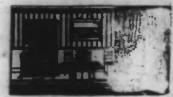
Les 33 pièces... 890 fr.

mérite votre confiance puisqu'il a déjà meublé PLUSIEURS MILLIERS DE CLIENTS. Et pour que tout le monde puisse profiter de nos multiples occasions et à des prix très bas, PENDANT TOUT LE MOIS DE MAI SEULEMENT nous consentirons des facilités de paiement au même prix qu'au comptant. (Tout est marqué en chiffres connus)