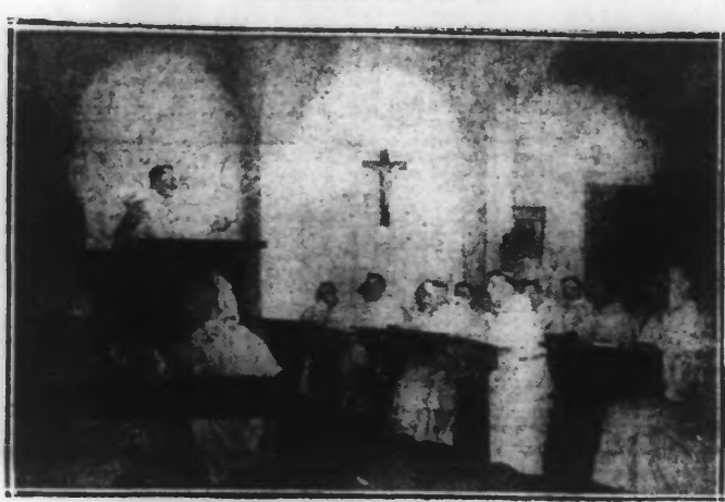
LA LEÇON DE THÉOLOGIE

La leçon de théologie, de M. Georges Dervaux