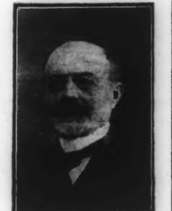
M. HERRIOT un des chefs nationalistes

Berne, 14 mai. — D'après des informations venues de Berlin, on croit dans les milieux politiques allemands que le chancelier Marx ne quittera pas le pouvoir.