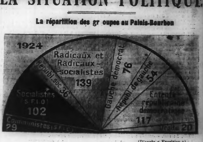
LA CHAMBRE DE 1924 : IL MANQUE 11 RESULTATS SUR 584.

Nous avons dit, dit « Excelsior », ici adopter la division par parti d'après la statistique officielle du ministère de l'Intérieur, mais il importe de ne pas oublier qu'un certain nombre de membres de la Gauche démocratique et qu'une quantité appréciable de républicains de gauche figuraient sur les listes du cartel des gauches, ce qui viendrait renforcer effectivement la « tranche hachurée » de notre troisième bicyclette.