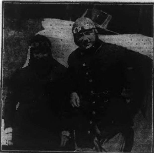
PELLETIER D'OISY (à droite) ET SON MECANICIEN (à gauche).

Il a accompli l'étape Saigon-Hanoi soit 1.300 kilomètres en sept heures vingt minutes. Paris, 14 mai. — Le service de l'aéronautique communique la note suivante: Pelletier d'Oisy est arrivé à Hanoi aujourd'hui à 14 h. 40 en parfait état de santé.