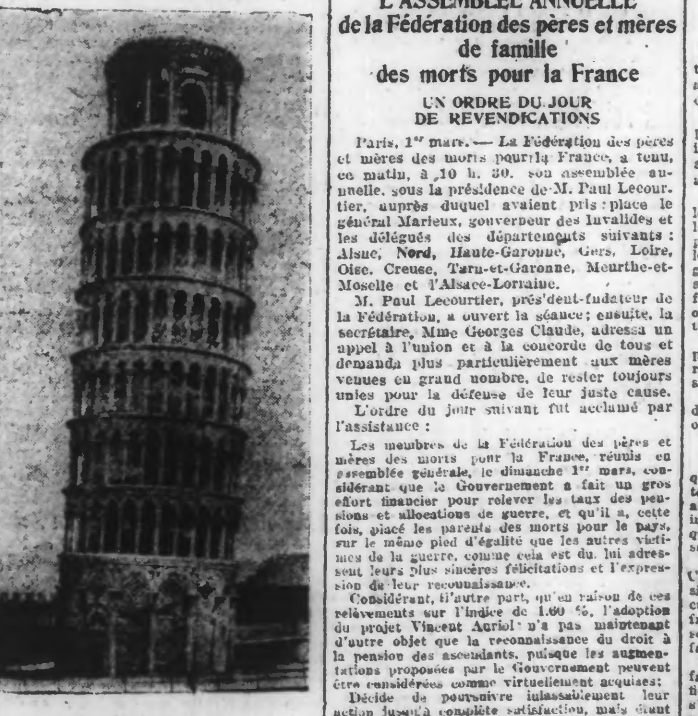
LA TOUR PENCHÉE DE PISE

Rome, 1 er avril. — Au sujet de bruits inquiétants qui ont été répandus sur le danger d'une chute possible de la Tour penchée de Pise, la « Tribuna » publie les renseignements suivants: