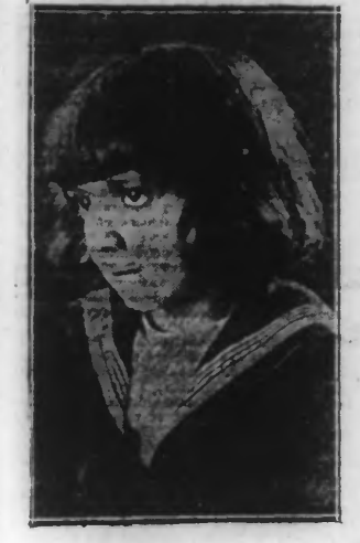
SON PREMIER AMOUR