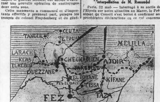
LA CARTE DES OPERATIONS. Les flèches indiquent la direction des offensives rifsaines.

Cambar se sont groupées en vue de cette attaque, sous les ordres du général de Chambrun en personne. Cette nouvelle attaque a été rendue nécessaire par suite de la présence de nouveaux rassemblements menaçant directement la ligne Oudja-Fez et la capitale religieuse du Maroc elle-même. Le combat a été très violent. Les premières nouvelles indiquent un plein succès pour nos armées. L'action s'est déroulée dans la région d'Aïn-Alcha. De l'interrogatoire des prisonniers capturés lors de la précédente affaire du massif de Bibane, il résulte, en effet, que Fes est l'objectif d'Abd-el-Krim. Il espère, en l'attendant, soulever un enthousiasme mystique qui ruinerait à jamais, pense-t-il, notre prestige dans l'empire chérifien.