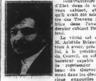
M. Pierre LAVAL

Vertical text on the right margin, possibly a list of prices or subscriptions.