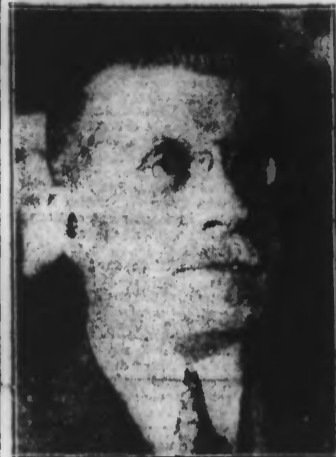
M. HENRY BÉRENGER