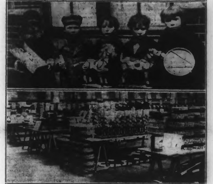
EN HAUT : UN GROUPE D'ENFANTS EN POSSESSION DE LEURS JOUETS. EN BAS : LES TABLES CHARGÉES DE JOUETS.

Samedi avait lieu l'occasion des fêtes de Noël, dans la salle de la rue de l'Horloge, une distribution de jouets faite par la Fraternelle des Combattants Roubaisiens.