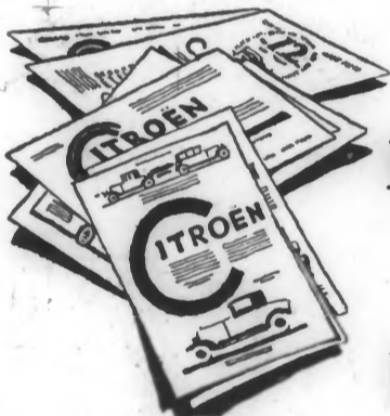
Publicité par pages entières dans la presse 1919-25