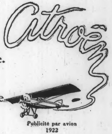
Publicité par avion 1922

1925 La construction des carrosseries tout-acier marque le début de la diffusion des voitures fermées.