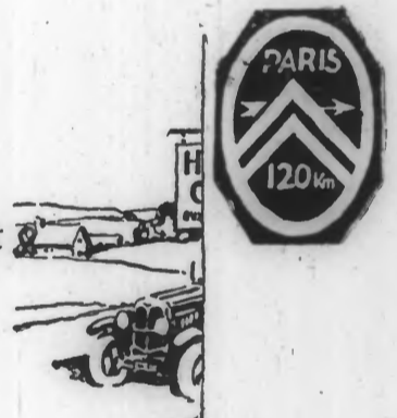
100.000 panonceaux de signalisation 1922-25