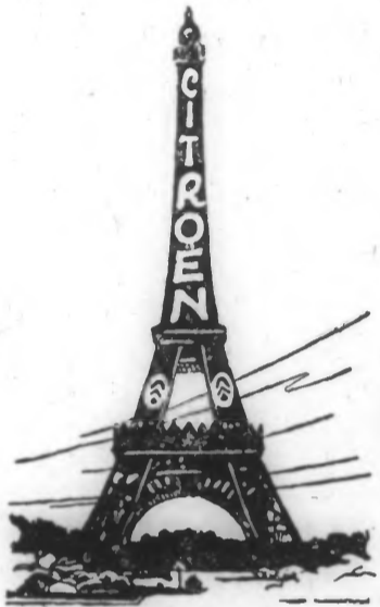
Publicité lumineuse 1925

ont été les innovatrices constantes de l'industrie automobile