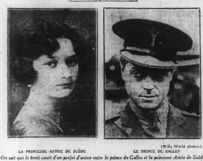
LA PRINCESSE ASTRIE DE SUÈDE LE PRINCE DE GALLES

On sait que le bruit court d'un projet d'union entre le prince de Galles et la princesse Astrie de Suède