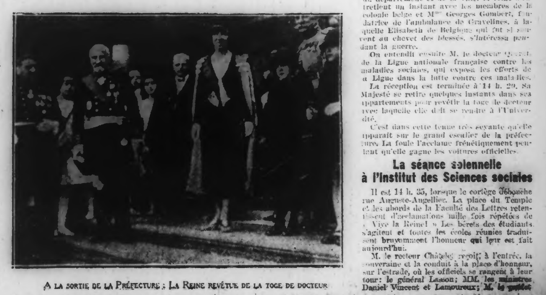
A LA SORTIE DE LA PRÉFECTURE: LA REINE REVÊTUE DE LA TOGE DE DOCTEUR