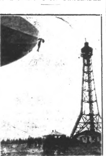
UN HOMME DE L'EQUIPAGE VIENT DE DETACHER L'AMARRE

Une perilleuse situation a été créée à l'avant d'un dirigeable. Un homme de l'équipage a détaché l'amarre, ce qui a causé de nombreux problèmes. Une perilleuse situation a été créée à l'avant d'un dirigeable. Un homme de l'équipage a détaché l'amarre, ce qui a causé de nombreux problèmes.