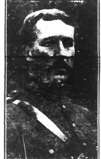
ALBERT I er , roi des Belges