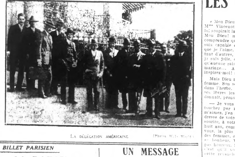
LA DÉLÉGATION AMÉRICAINE