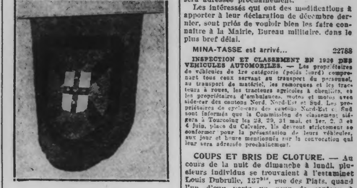
LE DRAPEAU DES «AMIS DE TOURCOING»

Pour consacrer davantage son existence et à l'occasion de l'anniversaire de sa création, le S. I. a décidé d'avoir un drapeau. Simple de lignes et de couleurs, ce drapeau a été composé sur les mêmes bases que celles de l'insigne: de la même forme que les anciennes bandières de sociétés locales, il est jaune dans son ensemble, est traversé par une croix de Saint-André rouge et a, au centre, l'écusson de Tourcoing. Ainsi, il rappellera le passé et, avec le