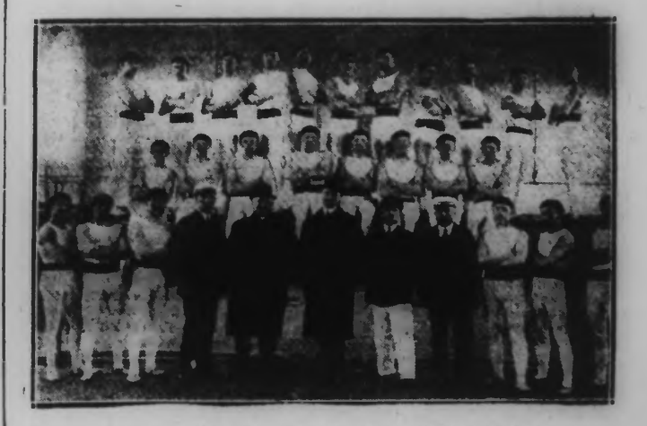
LA DÉLÉGATION DE L'UNION TOURQUENNOISE AU CONCOURS DE LYON