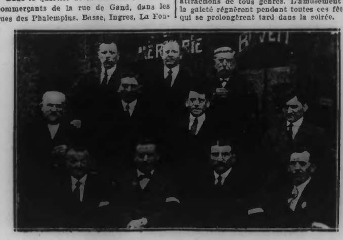
LE COMITÉ DES FÊTES DES PHALEMPINS

Les jubilataires ont ensuite regagné leurs voitures, recevant les félicitations de leurs parents et amis, ainsi qu'un grand nombre de bouquets, puis, toujours accompagnés d'un imposant cortège, ils se sont rendus à