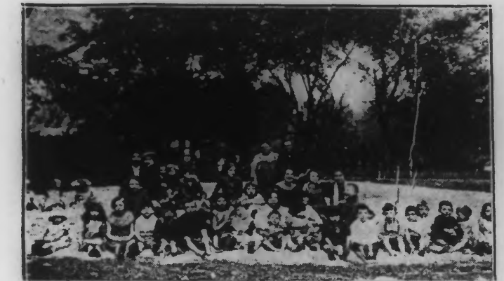
UN GROUPE D'ENFANTS AU COURS DE LEURS ÉBATS Depuis quelques jours, les services municipaux ont fait déverser sur le terrain...