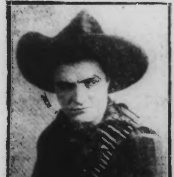
Le film passait, avec un VOIX DANS LA TEMPETE