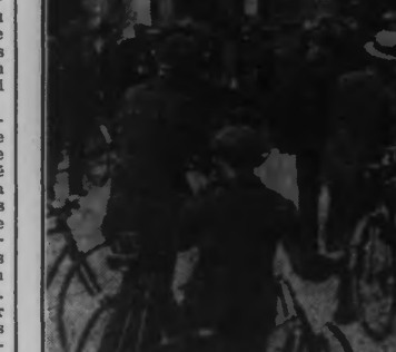
LA FOULE DEVANT LE « JOURNAL DE ROUBAIX » OÙ SONT AFFICHÉS LES RÉSULTATS DU TOUR DE FRANCE