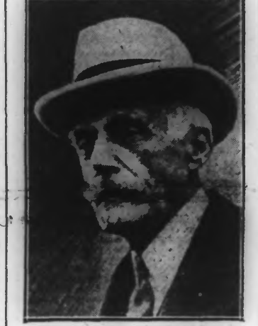
M. MELLON secrétaire du Trésor aux Etats-Unis