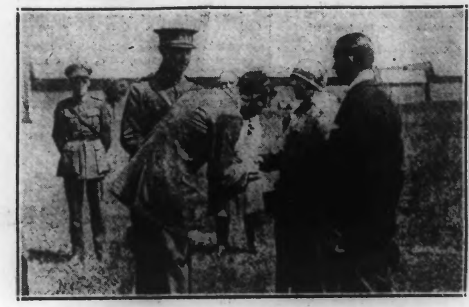
LA FAMILLE ROYALE BELGE ACCUEILLANT LE HÉROS DE L'ATLANTIQUE Charles Lindbergh s'incline devant la reine Elisabeth