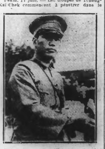
LE GÉNÉRAL CHIANG KAI-SHEK Chantoung, les forces nordistes s'opposent guère de résistance. Leur moral est mauvais.

Genève, 17 juin. — Le Conseil de la S.D.N. a terminé sa session cet après-midi. A 14 h. il s'est occupé notamment de l'emprunt de la Conférence, convoquée sur l'initiative du Président Coolidge et qui s'ouvrira, lundi, les fonctions d'informateur du Gouvernement français.