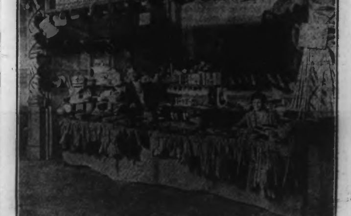
UN DES STANDS DE LA REMARQUABLE EXPOSITION DE LA SALLE DES FÊTES DE LA RUE DE L'HOSPICE

Continuant l'examen de la situation des aliénés de guerre, sous la présidence autorisée de M. Vincent, la commission adopte à l'unanimité, au sujet des appareils orthopédiques fournis par les centres d'appareillage, l'assemblée reprend et adopte de nouveaux vœux émis en 1926.