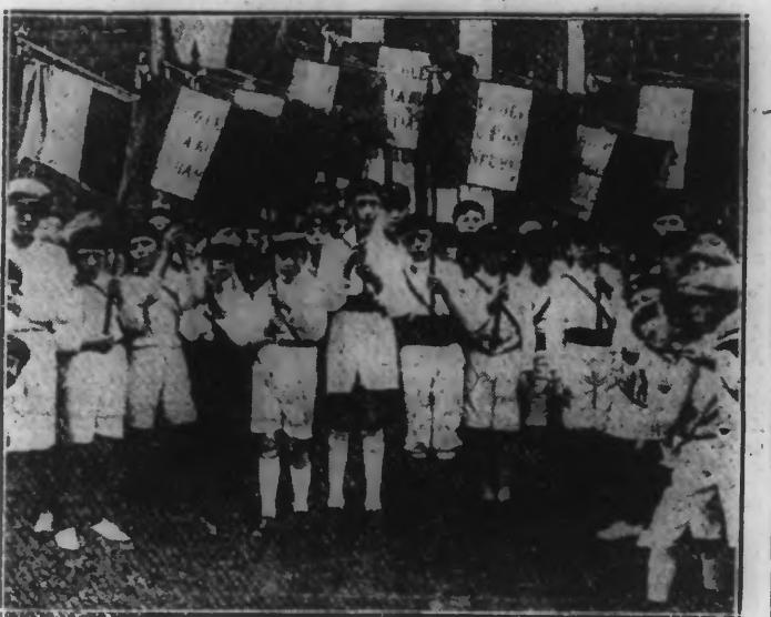
LES FANIONS DES GROUPES DES ECOLES.

Ouverte samedi par une splendide fête de la Jeunesse et par les concours individuels, elle se poursuivra aujourd'hui par les concours de sociétés et une fête officielle au stade de l'Union Sportive Tourquennoise.