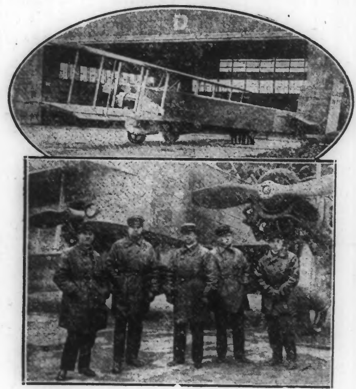
EN HAUT: L'AVION BI-MOTEUR LE « GEORGES-GUYNEMER » EN BAS: L'ÉQUIPAGE DEVANT L'APPAREIL