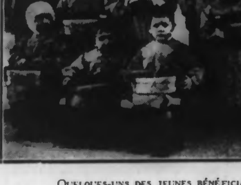
QUELQUES-UNS DES JEUNES BÉNÉFICIAIRES DES CADEAUX DU COMITÉ

Comme chaque année, le Comité de l'Arbre de Noël s'est rendu samedi à l'hôpital de la Fraternité, faire une distribution de jouets aux enfants malades et de layettes aux mères de nouveau-nés.