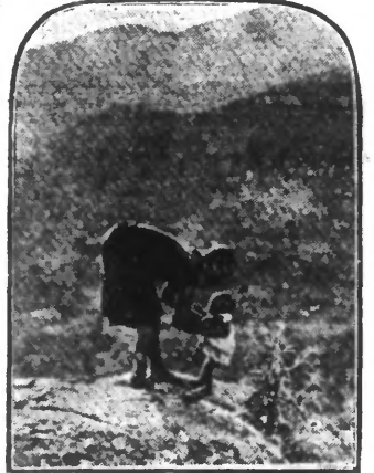
Chez les nègres de Wapare, quand un enfant commence à se tenir sur ses jambes, la mère — pour savoir s'il est normal — l'expose sur le sommet d'un mont où se trouve un précipice. Si l'enfant reste ainsi sans tomber, c'est qu'il est reconnu sain de corps et d'esprit; s'il tombe, c'est tant mieux, car il est reconnu anormal.