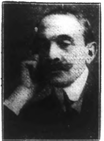
M. le Docteur Voronoff

La France peut faire une économie de quatre milliards par an en appliquant sa méthode aux béliers