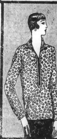
CASAQUIN en linon... 23. »