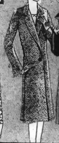
PALETOT tailleur... 99. »