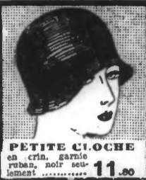
PETITE CLOCHE... 11.80