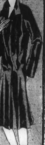
MANTEAU de soie... 195. »