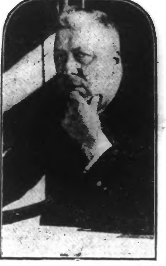
LE DOCTEUR ECKENER commandant du « Zeppelin »

Le docteur Eckener, commandant du « Comte-Zeppelin », dans un dessin incompréhensible, a soudainement délégué une violente campagne d'excitation et de diffamation contre la France; il nous a accusé d'avoir accumulé les difficultés pour entraver l'exécution du raid et de n'avoir exigé que l'on nous indique la route que suivra l'aérostat dans sa traversée de notre territoire.