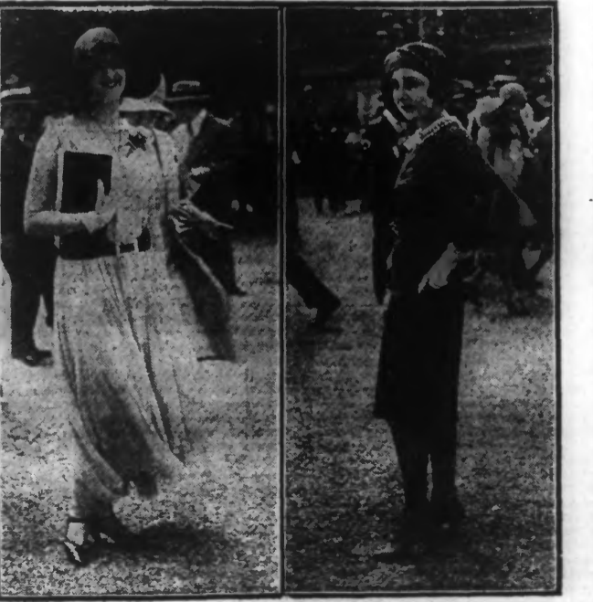
TOILETTES VUES AU BOIS DE BOULOGNE (W.W.P.)