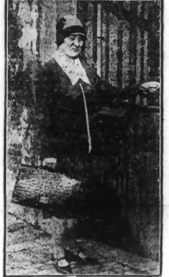
Mlle LUCIE DESJARDINS du parti socialiste qui a été élue aux dernières élections législatives comme députée de Liège (W.W.P.)