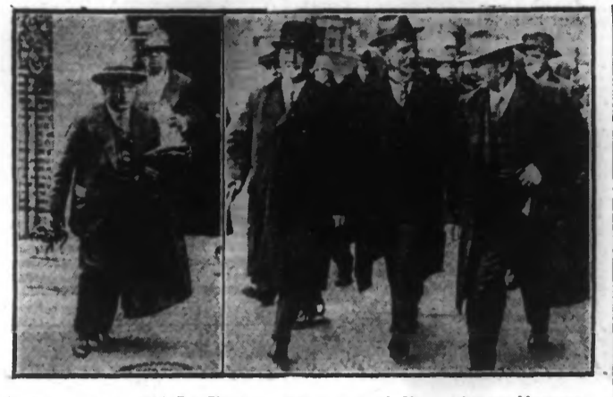
De gauche à droite : MM. BEN TILLET, président des Trade-Unions; ARTHUR HENDERSON, secrétaire du parti travailliste; MAC DONALD ET THOMAS

Londres, 1 er juin. — Les travaillistes occupent pour la première fois la première place. Que fera le premier ministre ? Certains pensent que, même sans autre raison, la malice du roi est un motif suffisant pour éviter toute précipitation.