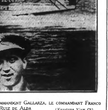
Le « NUMANCIA » et, de gauche à droite, LE COMMANDEANT GALLARZA, LE COMMANDEANT FRANCO ET LE CAPITAIN RUZ DE ALDA

Mellilá, 25 juin. — L'hydravion « Jupiter » qui est affecté au service particulier du haut-commissaire espagnol au Maroc, parti ce matin à 10 heures, est rentré après avoir survolé la côte jusqu'au Cap Saint-Vincent, sans aucun résultat.