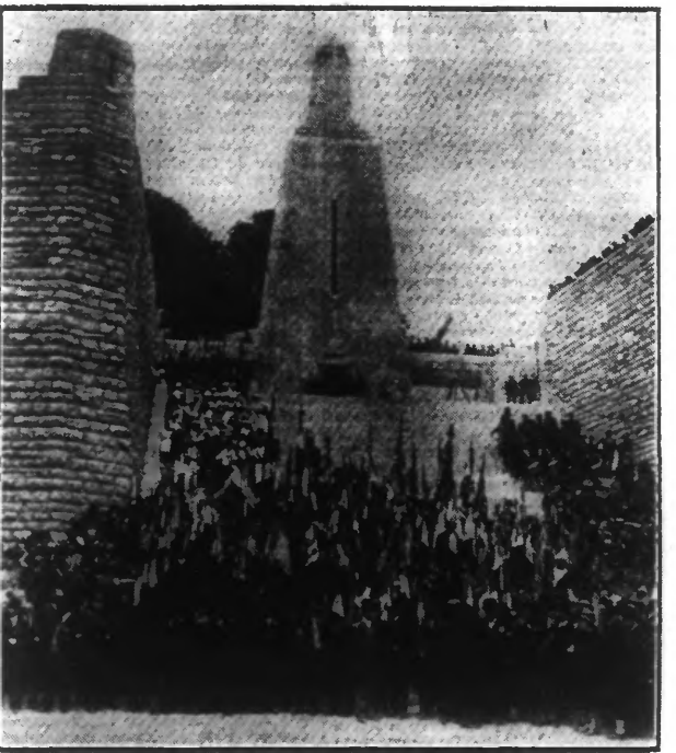
LES DRAPEAUX DE LA VICTOIRE, LE 23 JUIN