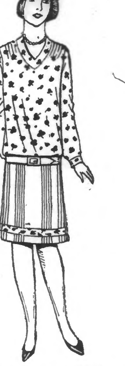
ROBE toile de coton extra, parure écossaise. 25 fr