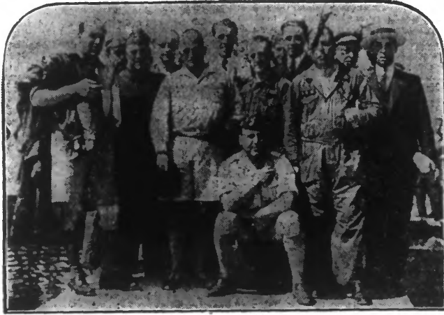
Notre photo montre les aviateurs, avant de quitter Alcazara. A l'extrême gauche, au premier plan, RUIZ DE ALDA; le troisième, au premier plan, FRANCO; assis, GALLARZA

Madrid, 30 juin. — Une note officielle communiquée à la Presse au sujet du sauvetage des aviateurs dit notamment : « La Jole du gouvernement, à l'occasion du sauvetage est d'autant plus grande que son désespoir était grand au sujet de leur sort. Le peuple espagnol, qui supportait la malheur avec tristesse, mais avec dignité, a su donner la vraie expression de sa voix, en se rendant à l'ambassade d'Angleterre exprimer sa gratitude à la nation amie qui, avec les puissants moyens offerts spontanément, est arrivée à nous donner la présente satisfaction. Nous ne devons pas oublier les efforts faits par le Portugal, l'Italie, la France, pour coopérer aux recherches, car notre gratitude est non seulement provoquée par le succès, mais par les démonstrations de solidarité humaine et d'amitié pour l'Espagne qu'on a vues à cette occasion. Le gouvernement remercie la Presse pour son attitude et la charge de féliciter en son nom les amis des aviateurs. »